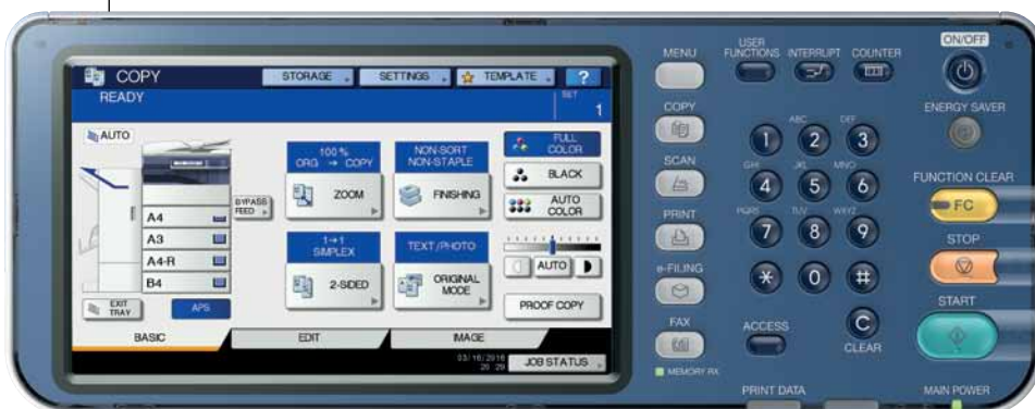
Die übersichtliche Menüsteuerung macht die Bedienung mit dem großen Touchpanel besonders einfach und effizient.

Außerdem stehen Ihnen verschiedene optionale Systemerweiterungen zur Verfügung – angefangen beim automatischen 100 Blatt Vorlagenwender für Ihre Originale bis hin zu verschiedenen Papierkassetten und der 2.000 Blatt Großraumkassette. Mit sämtlichen Optionen wächst die Papierkapazität auf bis zu 2.900 Blatt. Je nach Konfiguration stehen bis zu fünf verschiedene Papierquellen zur Verfügung.