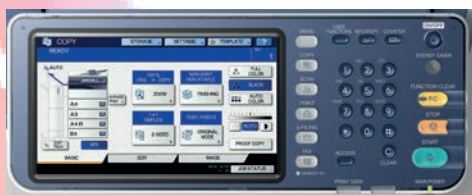
Intuitiv zu bedienendes Touchpanel

Unterschiedliche Papierzuführungen erhöhen die Papierkapazität auf bis zu 3.200 Blatt und ermöglichen es einzelnen Nutzern oder Abteilungen, auf bestimmte Papierformate, Farbblätter oder Briefpapier zu drucken. Optionale Endverarbeitungsmodulare wie Multipositionshefter, Locheinheit, Broschüren- oder der kompakte innere Finisher helfen bei der effizienten Erstellung professioneller Dokumente.